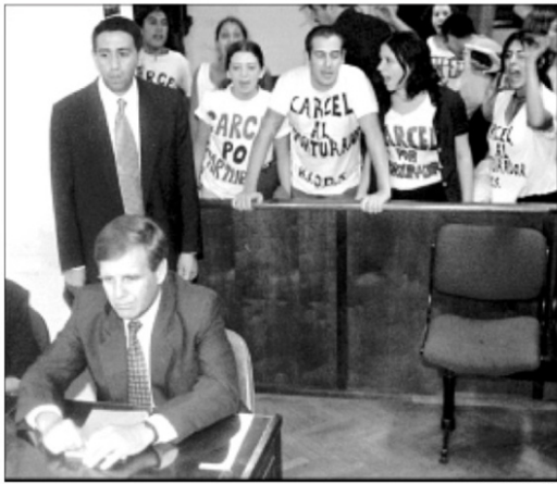
Astiz (sentado) es increpado por hijos de desaparecidos el año pasado cuando fue juzgado por apología del delito

El Gobierno argentino no se ha pronunciado sobre la intención de Astiz ni sobre la intención de la Justicia italiana de juzgarle.