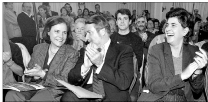
Mayor Oreja estuvo ayer arropado en Zarautz por la comisaria europea Loyola de Palacio y por María San Gil, cabeza de lista por Guipúzcoa

Antes de conocerse la ocurrencia salomónica de Mayor, Javier Arenas había tratado de aplicar un poco de ungüento a los sarpuillos surgidos a cuenta del debate: «El Partido Po-