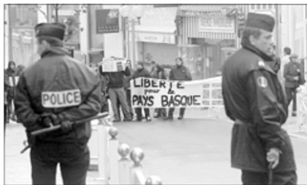
Un grupo de jóvenes abertzales se manifiesta en Biarritz

Anai Artea, la asociación de acogida a los militantes refugiados en Francia que fue durante años el centro neurálgico de la estructura de la banda.