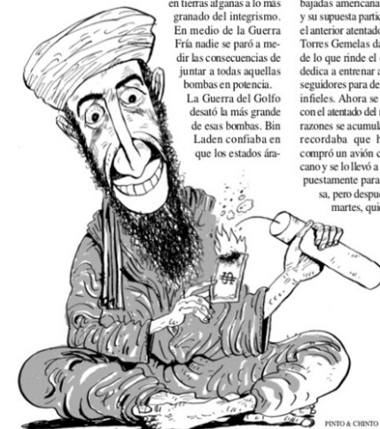
PINTO A CHINTO

Los atentados contra las embajadas americanas en Kenia y su supuesta participación en el anterior atentado contra las Torres Gemelas dan muestra de lo que rinde el dinero que dedica a entrenar a sus 5.000 seguidores para derrotar a los infieles. Ahora se lo vincula con el atentado del martes. Las razones se acumulan. Ayer se recordaba que hace años compró un avión civil americano y se lo llevó a Jartum, supuestamente para su empresa, pero después de lo del martes, quién sabe.