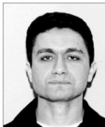
El supuesto terrorista Mohamed Atta

la residencia presidencial. Fleischer, sin embargo, no explicó por qué los terroristas decidieron cambiar sus planes en el último minuto. Tampoco reveló los detalles de la acción que supuestamente amenazó al Air Force One.