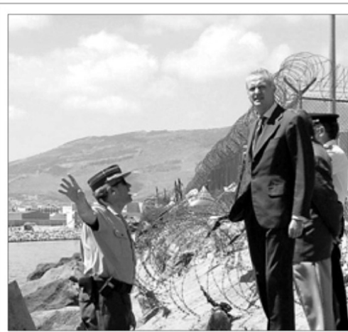
PREPARADOS PARA «CUALQUIER TIPO DE MEDIDA». El secretario de Estado para la Seguridad, Pedro Morenés, visitó ayer Melilla para supervisar el reforzamiento de la vigilancia en la frontera con Marruecos, y advirtió que España «no renuncia a ningún tipo de medida legítima» si el país vecino persiste en su «actitud injustificable». «Habrá medidas diplomáticas y todo tipo de presión», insistió el ministro de Interior, que aparece en la foto en el dique sur de Melilla, observando las obras de ampliación del puerto fronterizo de Nador.

El jefe del Ejecutivo subrayó la voluntad del Gobierno de mantener una relaciones «fluidas», basadas en el «respeto mutuo», aunque advirtió a Rabat que para recuperar el entendimiento es condición «imprescindible» volver al «statu quo anterior a la ocupación de la isla». Aznar, que aseguró estar convencido de contar con el «respaldo de la inmensa mayoría de la Cámara» baja en este contencioso, insistió en que «hacemos todos los esfuerzos para restaurar la legalidad internacional».