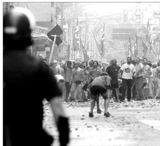
Ante la sede del Congreso se produjeron enfrentamientos entre simpatizantes de Duhalde y grupos lequistas.

El largo debate en la Asamblea Legislativa, la reunión conjunta del Congreso y el Senado, estuvo teñido por el drama-