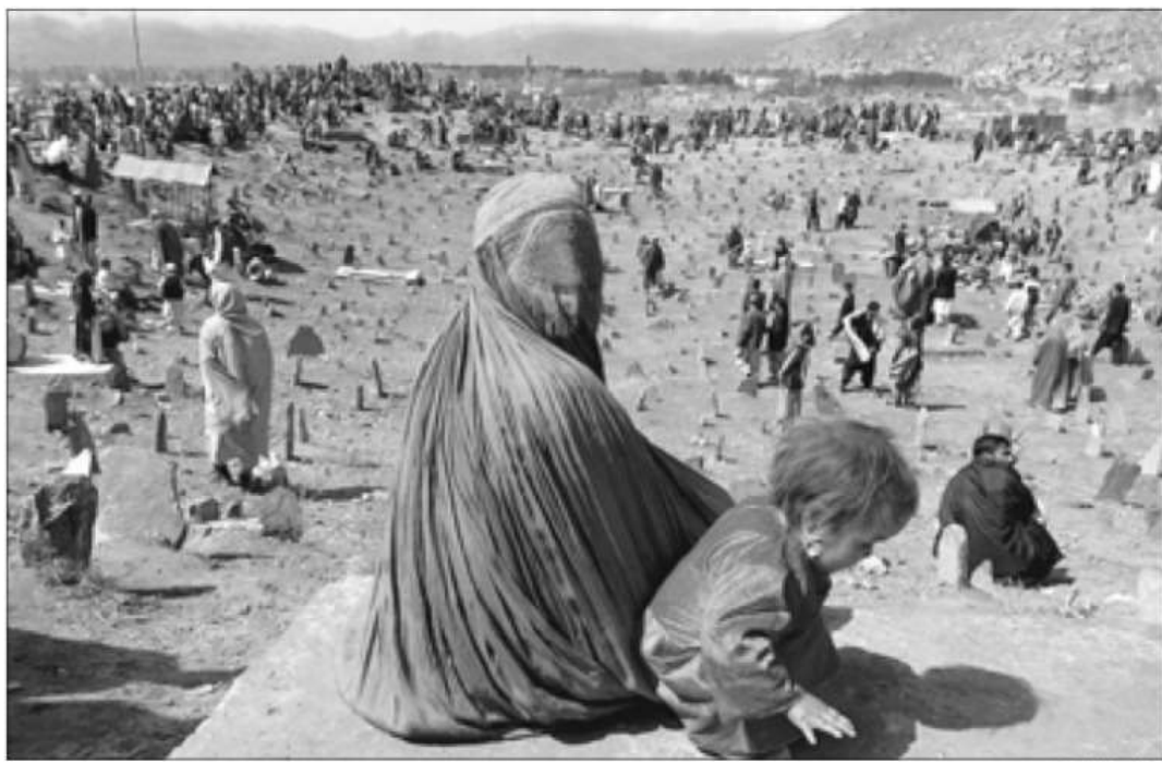
Una joven afgana y su hija en el cementerio de Kabul, testimonio de las numerosas catástrofes que han castigado a Afganistán en los últimos años

La ISAF ya transportó al lugar de la tragedia en helicóptero a un grupo de expertos en emergencias de distintos organismos, que ha instalado un equipo de comunicaciones que será clave para la coordinación de las operaciones. El mismo helicóptero sobrevoló después la zona afectada para hacer un reconocimiento de la situación, lo que puede servir de orientación a la ONU y a las distintas ONG sobre las actuaciones prioritarias.