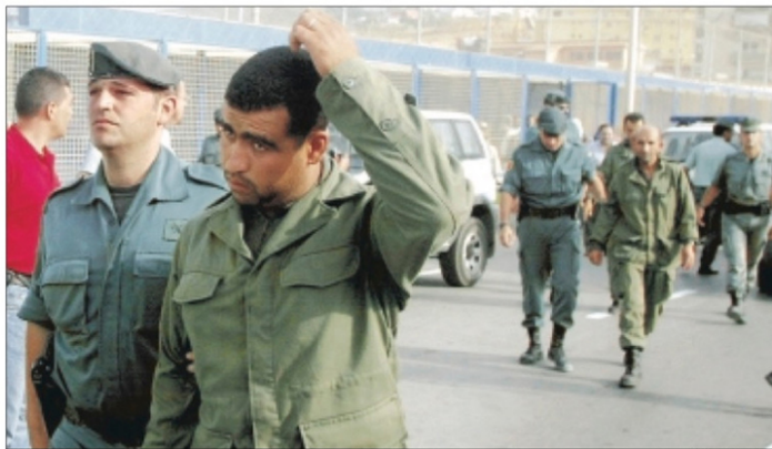
Efectivos de la Guardia Civil acompañan a los soldados marroquíes apresados en la isla de Perejil, para entregarlos a las autoridades de su país

Tras comprobar que no quedaban más marroquíes en la isla, las tropas españolas fueron relevadas por un tercio de la Legión, que tomó posesión de la isla y plantó dos banderas espa-