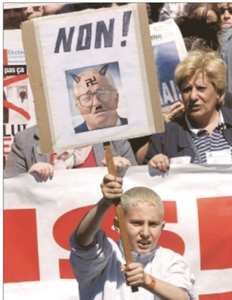
Los marseleses también se manifestaron contra el dirigente ultraderechista Le Pen

Con los resultados de la primera vuelta en la mano, hoy se verá cuánto del voto marseles sólo quiso castigar a los partidos tradicionales en la primera vuelta y cuántos votaron a Le Pen convencidos. Con el triunfo nacional de Chirac asegurado, que-