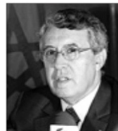
Benaissa, ayer, durante la rueda de prensa sobre Perejil

«presencia regular» en el islote. El Gobierno recibió ayer por la mañana respuesta oficial a la nota verbal enviada por España el día de la invasión, pero explicó que la comunicación oficial marroquí «no aporta argumentos convincentes ni elementos nuevos en apoyo» a las tesis de Rabat. Mientras, la ministra de Exteriores, Ana Palacio, advirtió al país magrebí de que la soberanía de las plazas españolas en el norte de África nunca será objeto de negociación alguna y que estudia ya las sanciones económicas. Palacio fue tajante: «Espero que Marruecos ni recurra al victimismo ni intente abrir cuestiones que están perfectamente cerradas».