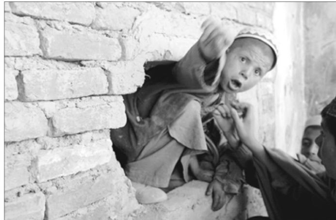
Un niño salta a través de la pared de uno de los edificios de la antigua embajada rusa, donde aún malvivían 4.000 antiguos prisioneros de los talibanes

y la otra con los pies. Muchas noches no podías dormir por los gritos de la gente que se llevaban y que torturaban. A mí casi me matan a golpes un día que me aparté para orinar. Cuatro de mis compañeros murieron así, a golpes. Otros, que rechazaron la visita que nos permitieron cuando llevábamos siete meses, murieron de hambre al quedarse sin comida». Cuenta. Cuando fue liberado, Mohamed vino a la embajada porque toda su familia estaba