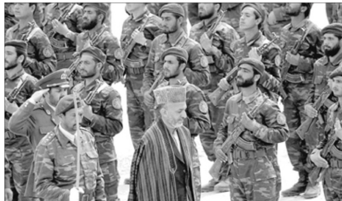
El presidente interino, Hamid Karzai, pasa revista a los hombres que integran el nuevo ejército de Afganistán.

No hubo público. Sólo se permitió la entrada a los periodistas acreditados. Incluso faltó el ministro de Defensa, que tenía una silla reservada, con la excusa de que tenía que viajar a Kandahar. La realidad es mucho más cruda. El general Fahim lanzó un órdago al Go-