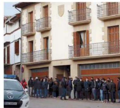
El domicilio familiar recibió numerosas visitas a lo largo de la tarde. J. A. BORI

El funeral se celebrará también por la tarde, a las 18 horas, en el patio del colegio público Reina Urrea, situado justo detrás de la entrada principal. Precisamente, en este centro escolar, miembros de la Ayma le tributaron el pasado miércoles por la mañana otro cáli-