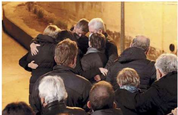
La familia más íntima se abrazó a las puertas del velatorio, tras la entrada del coche fúnebre.