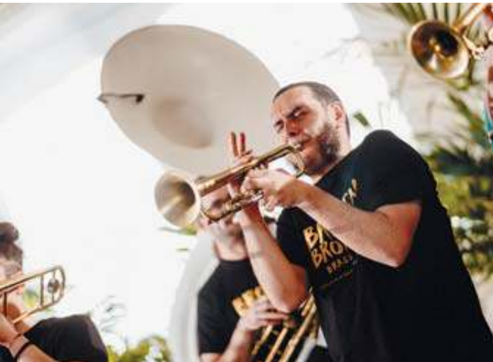
Los Broken Brothers Brass Band transformarán una jota navarra.