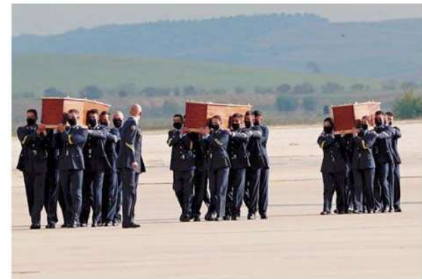
Traslado de los féretros en la base militar de Torrejón de Ardoz (Madrid) ayer por la mañana.