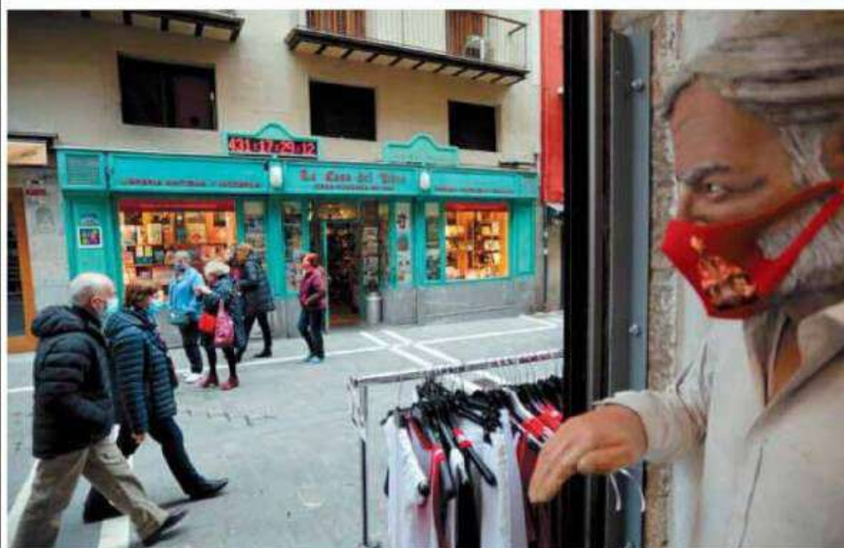
El reloj de la Casa del Libro de Pamplona con la cuenta atrás para los Sanfermines se ha vuelto a resetear tras el anuncio del alcalde. J.A. 18-19

La Tómbola de Cáritas regresa al Paseo de Sarasate