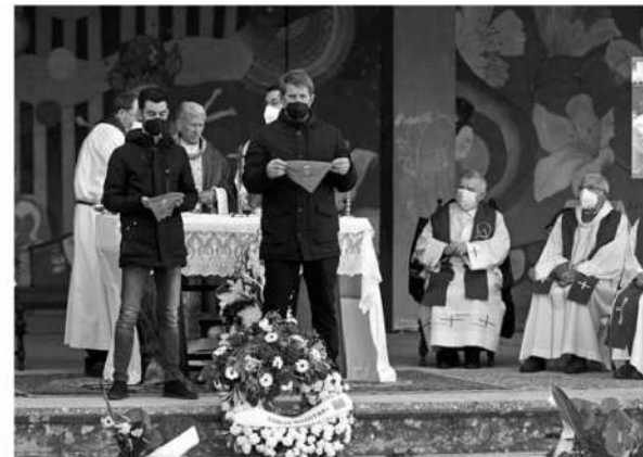
Dos vecinos de Artajona sujetan los pañuelos de la localidad durante la ceremonia.