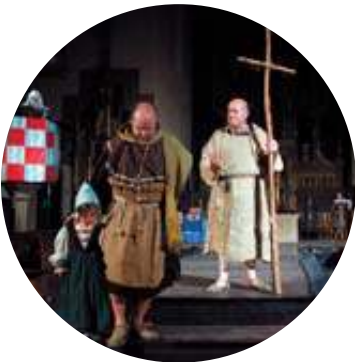
Un momento de la representación del Misterio de Obanos.