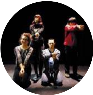
Un espectáculo de la Fundación Atena.