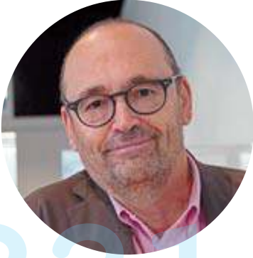
El arquitecto Patxi Mangado Beloqui (Estella, 1957).