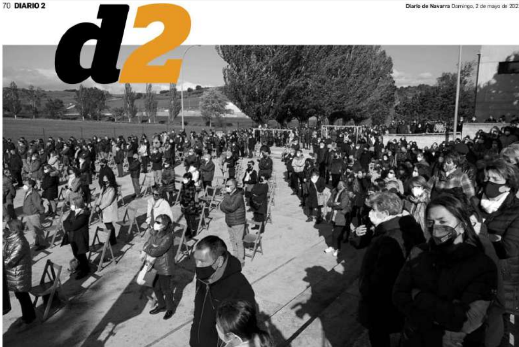
Cientos de vecinos de Artajona siguieron, sentados o de pie, el funeral en el colegio Reina Urraca.