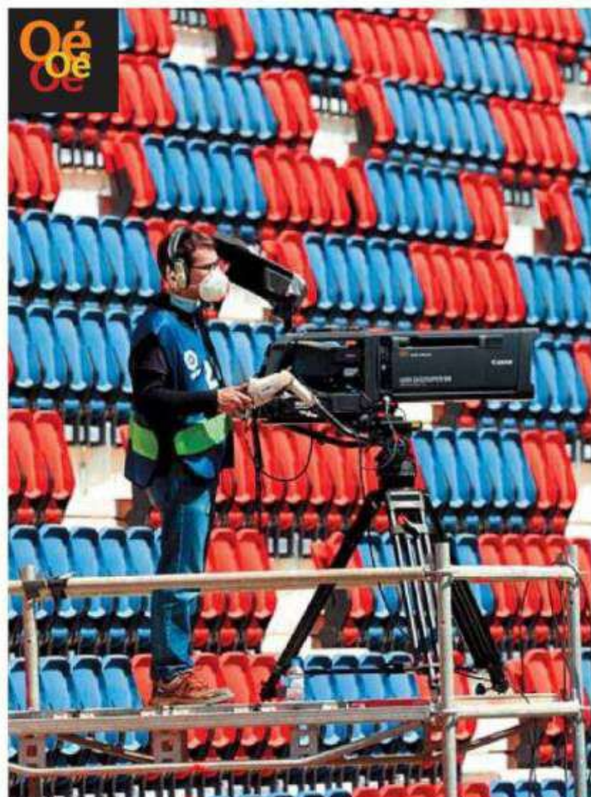
Un cámara de televisión en El Sadar, en el reciente Osasuna-Elche.